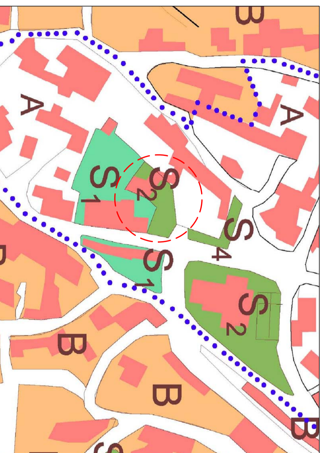
ESTRATTO DEL PUC - scala 1:1000